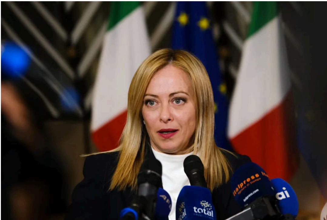
La premier Giorgia Meloni.